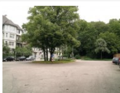
Sebastian-Buchegger-Platz: Hier soll 2016 der Westzugang zum Bahnhof entstehen

Thema des Tagesordnungspunktes 1 war der Projektbeschluss zur Neugestaltung des Augsburger Hauptbahnhofs. Kernstücke des 94,5 Millionen Euro teuren Umbaus: der behindertengerechte Ausbau, die Schaffung eines Westzugangs nach Pfersee und die Unterquerung des Bahnhofs mit der Straßenbahn auf einer zweiten Ebene (Ebene Minus 2) unterhalb des derzeitigen Fußgängertunnels zu den Gleisen.